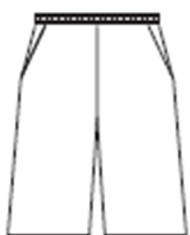
膝が隠れる長さの ショーツ