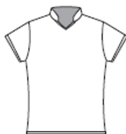
スタンドカラーゲームシャツ