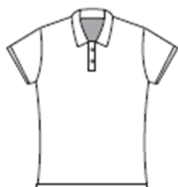
襟付きゲームシャツ