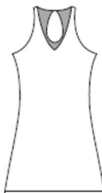
肩や背中が大きく カットされている ワンピース等の ゲームウェア