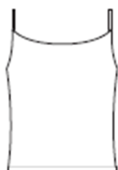
キャミソールタイプ