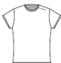
Tシャツタイプ (襟なし) ゲームシャツ