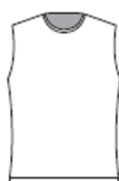
男子のみ ノースリーブ ゲームシャツ