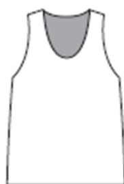
タンクトップ (ランニング) シャツタイプ